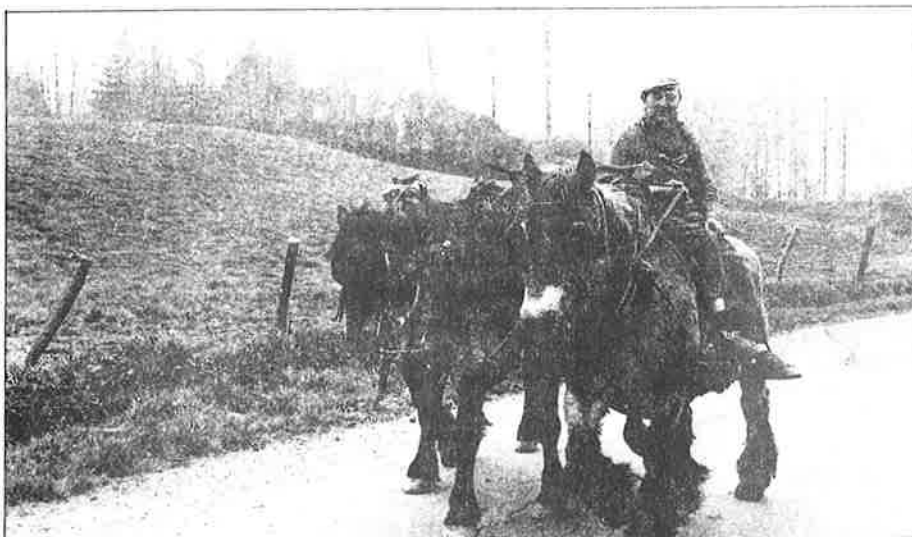
Ons land telt op dit ogenblik nog zo'n 15.000 trekpaarden. De Brabanders zijn vooral in de landbouw bedrijvig, de iets kleinere Ardeners worden in de Ardennen gebruikt voor het rooien van bomen.

«Voor hun Brabanders doen de Amerikanen de gekste dingen. Over mijn Wilma hebben ze ginder zelfs een elpee met country & western liedjes volgezongen. In Michigan wou iemand een merrie kunstmatig laten bevruchten door een van mijn hengsten die ik in Californië verkocht had. Michigan en Californië liggen echter 4.000 kilometer uit elkaar, zodat dat grapje 20.000 frank zou kosten.»